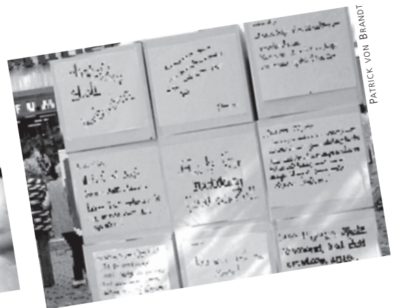
PATRICK VON BRANDT

Tarifliche Regelungen sind möglich! Ob eigener Tarifvertrag zur Ausbildungsqualität oder integrierte Regelungen im Tarifvertrag zum Gesundheitsschutz – es ist lediglich eine Frage eurer Durchsetzungskraft. Gemeinsam stark für bessere Ausbildungsbedingungen!