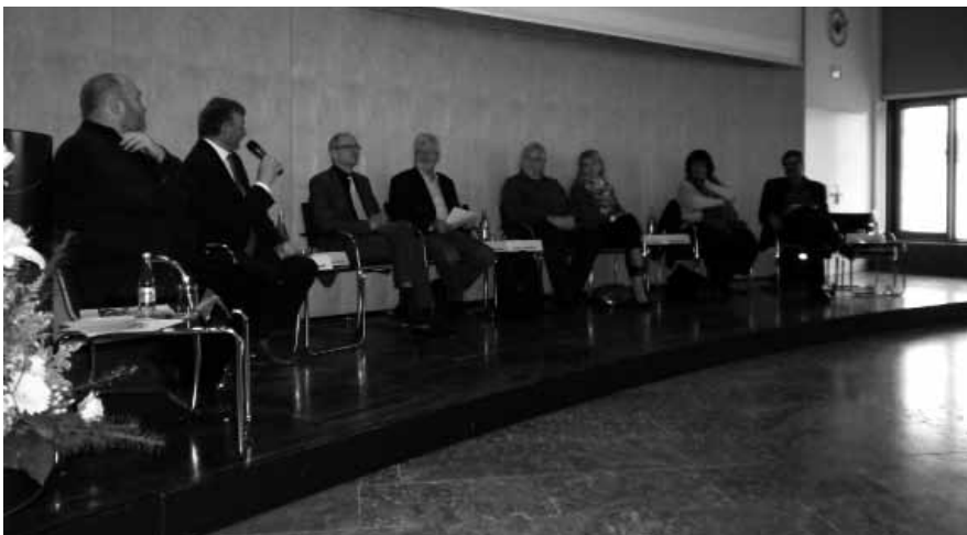
Podiumsdiskussion bei der Landeskrankenhauskonferenz mit Teilnehmern aller Parteien

Das Land Baden-Württemberg finanziert Krankenhausinvestitionen nur zur Hälfte. Die restliche Finanzierung - obwohl gesetzlich ebenfalls durch das Land zu finanzieren - bleibt an den Krankenhausträgern hängen. Diese finanzieren zunehmend ihre Baustellen über Nichtbesetzung von Personalstellen. Das betrifft derzeit ca. 5500 Stellen in den Krankenhäusern Baden-Württembergs. Damit das Land Baden-Württemberg seiner gesetzlichen Pflicht nachkommen kann, müssten die Investitionskostenzuschüsse an die Krankenhäuser auf 600 Mio. Euro jährlich