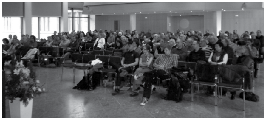
Landeskrankenhauskonferenz am 15.2. im großen Saal des Stuttgarter Rathauses: rege Teilnahme und interessante Vorträge

Link zur Studie: http://www.artec.uni-bremen.de/files/papers/paper_173a.pdf